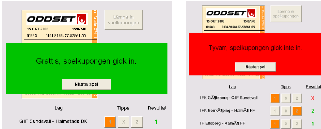
Figur B1. Utseendet av feedback under träningsfasen för singlar (t.v.) respektive tripplar (t.h.). 4